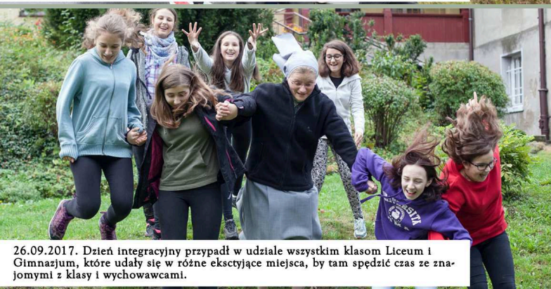
26.09.2017. Dzień integracyjny przypadł w udziale wszystkim klasom Liceum i Gimnazjum, które udały się w różne ekscytujące miejsca, by tam spędzić czas ze znajomymi z klasy i wychowawcami.