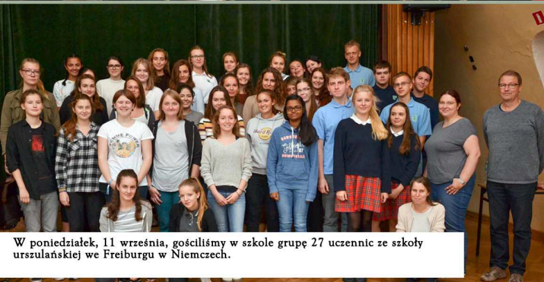
W poniedziałek, 11 września, gościliśmy w szkole grupę 27 uczennic ze szkoły urszulańskiej we Freiburgu w Niemczech.