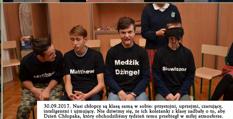
30.09.2017. Nasi chłopcy są klasą samą w sobie: przystojni, uprzejmi, czarujący, inteligentni i ujmujący. Nie dziwny się, że ich koleżanki z klasy zadbały o to, aby Dzień Chłopaka, który obchodziliśmy tydzień temu przebiegł w miłej atmosferze.