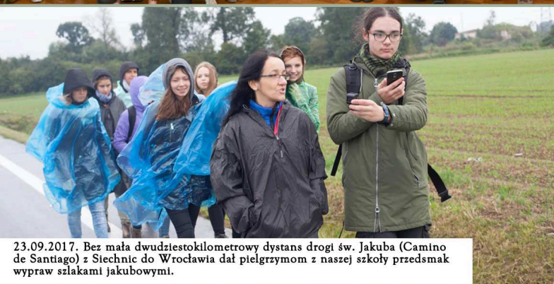
23.09.2017. Bez mała dwudziestokilometryowy dystans drogi św. Jakuba (Camino de Santiago) z Siechnic do Wrocławia dał pielgrzymom z naszej szkoły przedsmak wypraw szlakami jakubowymi.