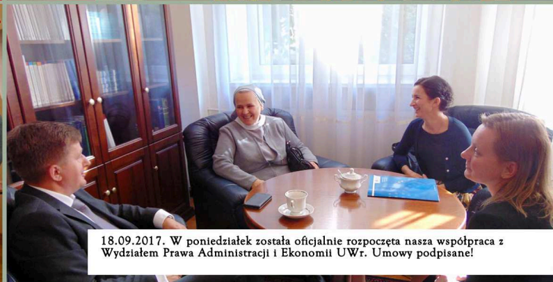
18.09.2017. W poniedziałek została oficjalnie rozpoczęta nasza współpraca z Wydziałem Prawa Administracji i Ekonomii UW. Umowy podpisane!