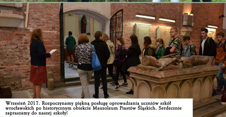
Wrzesień 2017. Rozpoczynamy piękną postać oprowadzania uczniów szkół wrocławskich po historycznym obiekcie Mauzoleum Piastów Śląskich. Serdecznie zapraszamy do naszej szkoły!