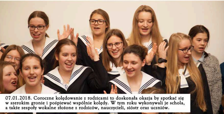
07.01.2018. Coroczne koledowanie z rodzicami to doskonała okazja by spotkać się w szerokim gronie i pośpiewać wspólnie koledy. W tym roku wykonywali je schola, a także zespoły wokalne złożone z rodziców, nauczycieli, sióstr oraz uczniów.