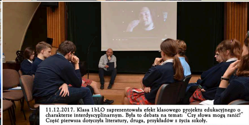
11.12.2017. Klasa 1bLO zaprezentowała efekt klasowego projektu edukacyjnego o charakterze interdyscyplinarnym. Była to debata na temat: „Czy słowa mogą ranić?” Część pierwsza dotyczyła literatury, druga, przykładów z życia szkoły.